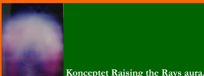
Konceptet Raising the Rays aura.

Med disse unikke Once in a Life-time aurabilleder har jeg, foruden egen clearness, bevist, at vi alle lever i et hologram... Det eneste bevis i verden. Det er sindssygt at tænke på.